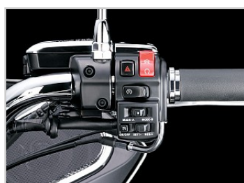
Régulateur de vitesse