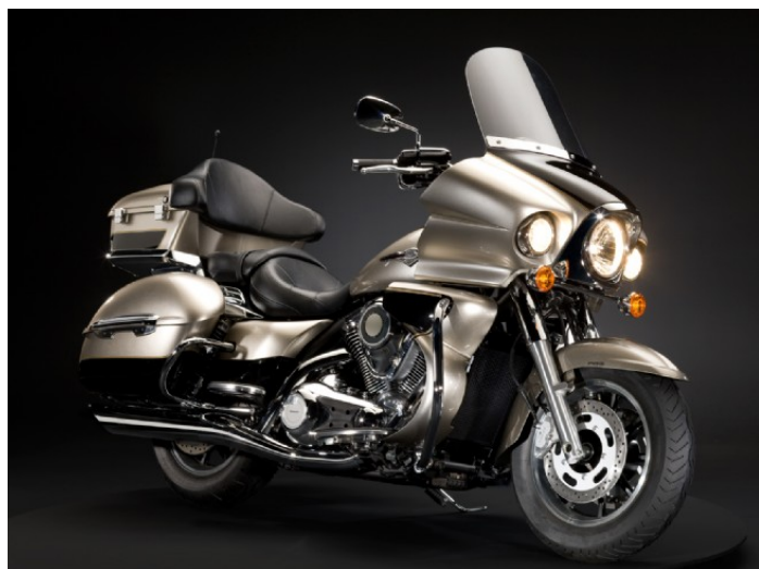
Année modèle 2009